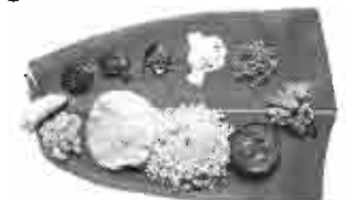
தானத்தில் சிறந்தது அன்னதானம் அன்னதானம் செய்வோம் ஆனந்தம் அடைவோம்

நிக்திய அன்னதானம் : சக்தி பீடத்தில் நிக்திய அன்னதானம் வழங்கப்படுகிறது. வடை பாயசத்துடன் சிறப்பு அன்னதானம் ரூ. 2500 நன்கொடைகளுக்கு வருமான வரிவிலக்கு 80G உண்டு.